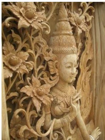
ภาพที่ ๕ ไม้แกะสลัก

๓. ประเภทเครื่องตกแต่ง งานประดิษฐ์ตกแต่ง ทำขึ้นเพื่อความสวยงามและเป็นสิ่งประดิษฐ์ใช้กับ บ้านเรือน นอกจากนี้บางชิ้นงานสามารถนำมาใช้ในด้านการใช้สอยได้ เช่น กรอบรูป โคมไฟ ภาพวาด งาน แกะสลัก