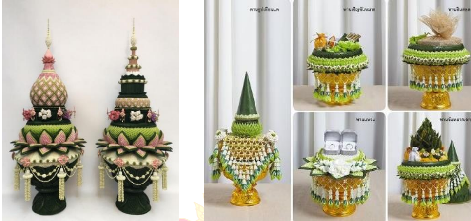
ภาพที่ ๗ พานบายศรี

๔. ประเภทเครื่องใช้ในพิธี ทำขึ้นเพื่อใช้ในพิธีทางศาสนา ในช่วงโอกาสต่าง ๆ และงานประเพณีสำคัญ เช่น งานลอยกระทง งานวันเข้าพรรษา ออกพรรษา งานศพ งานประดิษฐ์เครื่องใช้ เช่น พานพุ่ม มาลัยบายศรี การจัดดอกไม้ในงานศพ