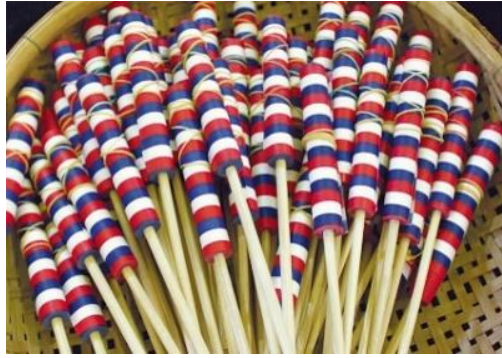
ภาพที่ ๑ ไม้มายากล