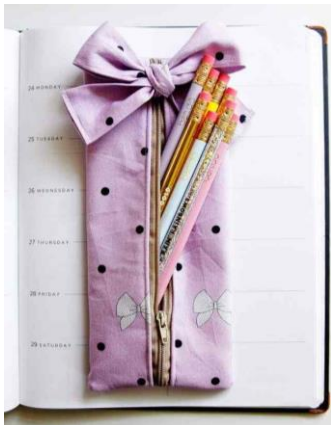
ภาพที่ ๓ กล่องดินสอ

๒. ประเภทเครื่องใช้ งานประดิษฐ์เครื่องใช้ เป็นชิ้นงานที่ทำขึ้นเพื่อความสะดวกสบายและเป็นเครื่อง ทุนแรงในการดำเนินชีวิต หรือประกอบอาชีพในชีวิตประจำวัน เช่น เสื้อผ้า แจกกัน หมวก ตะกร้า กระดาษ และเชง