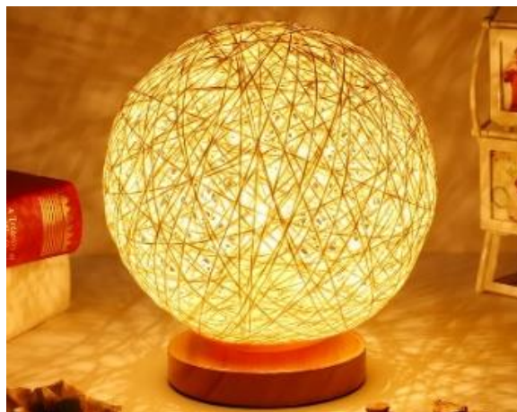
ภาพที่ ๖ โคมไฟเชือก