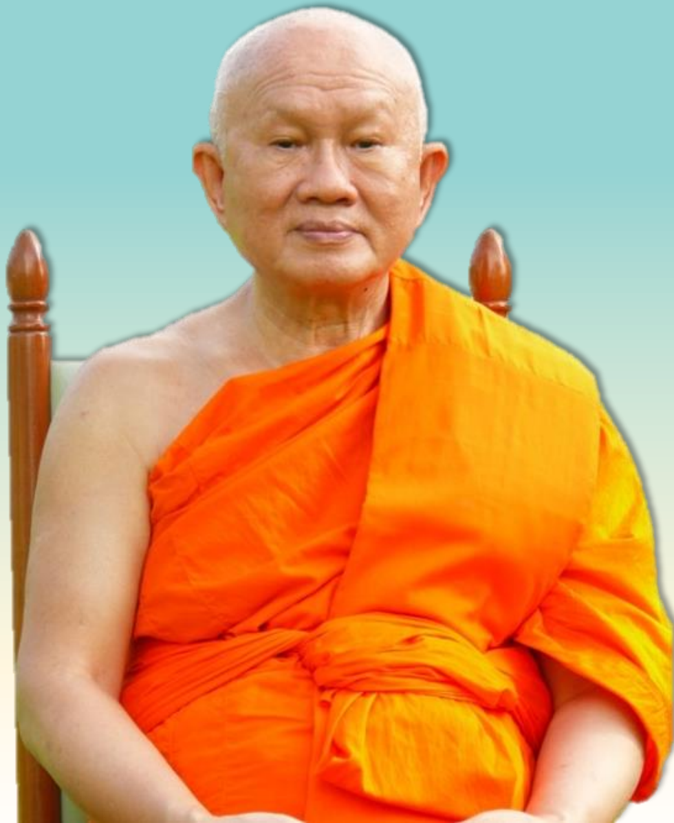
สมเด็จพระพุทธโฆษาจารย์ (ประยุทธ์ ปยุตฺโต), ศาสตราจารย์ (พิเศษ)