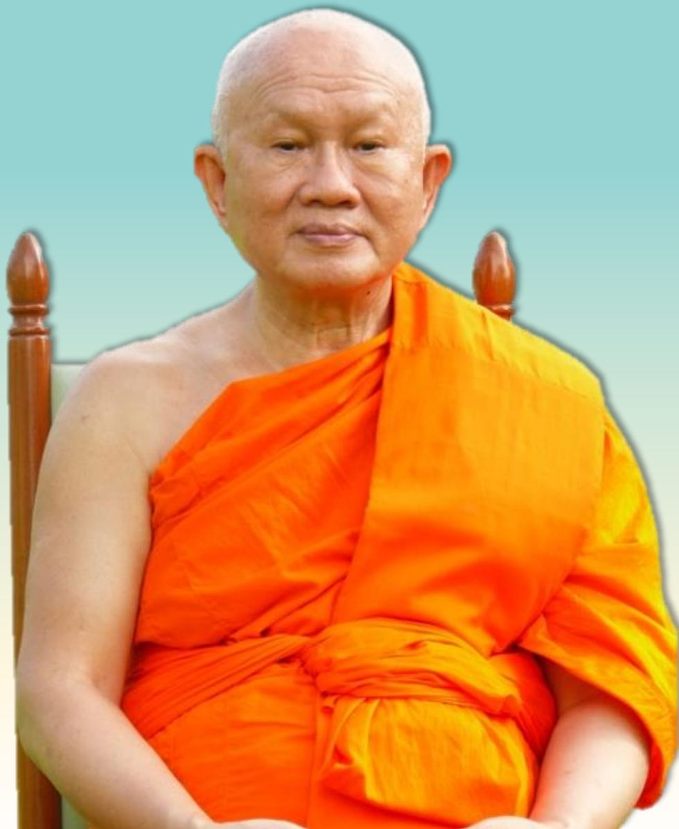
สมเด็จพระพุทธโฆษาจารย์ (ประยุทธ์ ปยุตฺโต), ศาสตราจารย์ (พิเศษ)