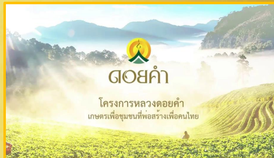
โครงการหลวงดอยคำ