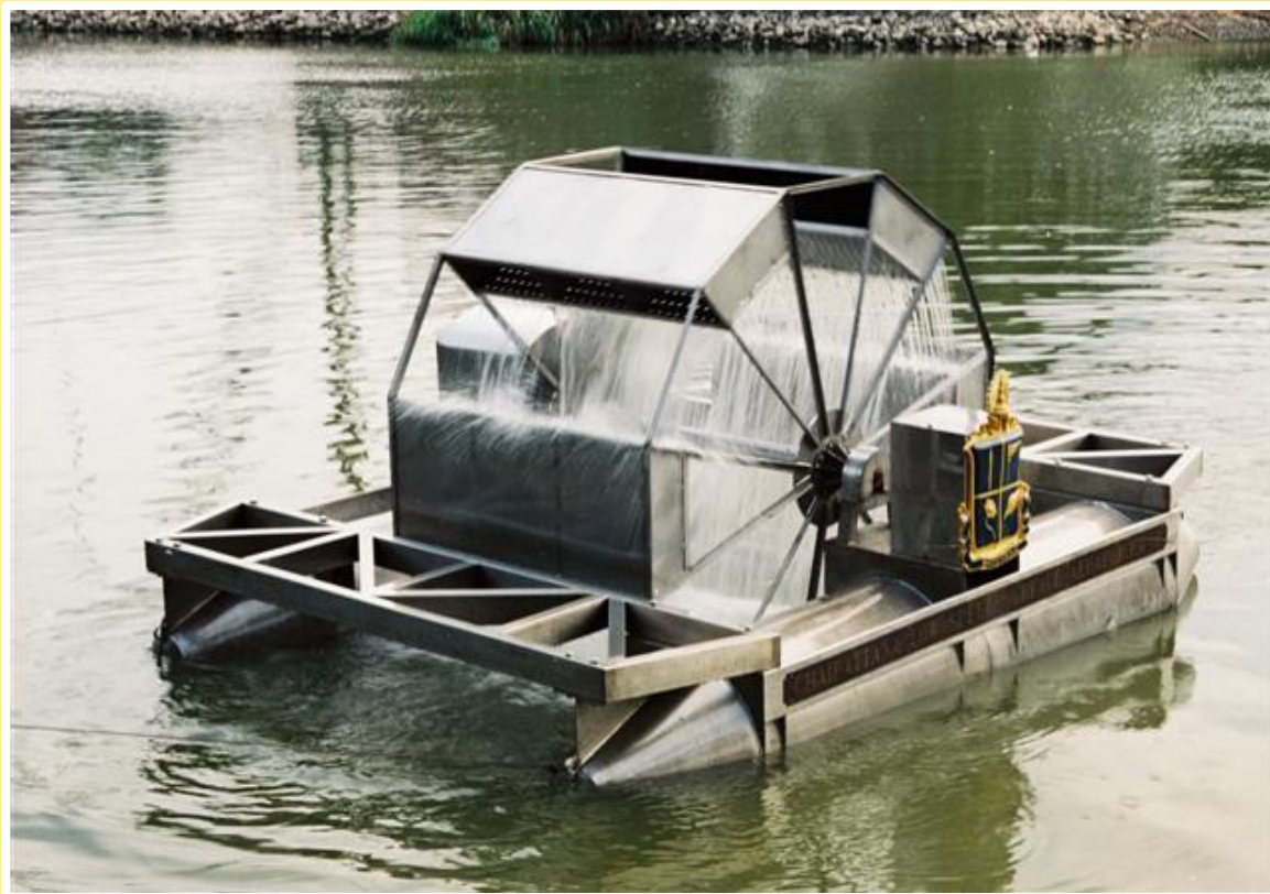
กังหันน้ำชัยพัฒนา

https://www.chaipat.or.th/chaipattana-water-turbine/chaipattana-water-turbine-rx2/2013-05-29-17-52-10.html