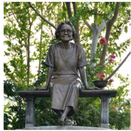
โครงการสวนสมเด็จพระศรีนครินทร์ทราบ รมราชชนนี ต.สามพระยา อ.ชะอำ จ.เพชรบุรี