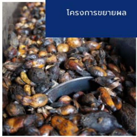
โครงการโรงงานสกัดน้ำมันพืชและผลิต ไบโอดีเซลครบวงจร จ.เพชรบุรี