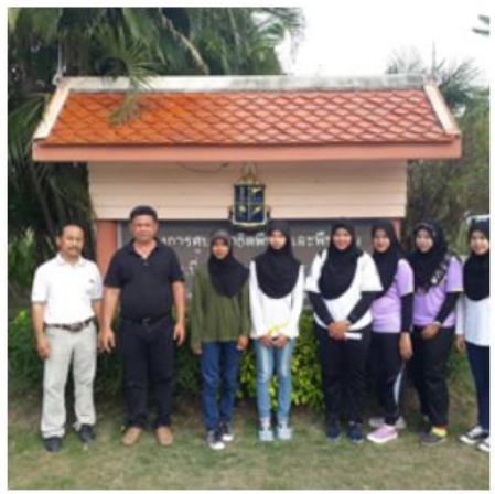
โครงการศูนย์สาธิตพืชไร่และพืชสวน อันเนื่องมาจากพระราชดำริ ต.ท่าแร่ อ.บ้านแหลม จ.เพชรบุรี