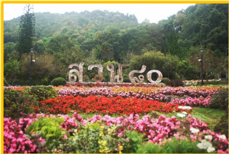
สถานีเกษตรหลวงอ่างขาง อ.ฝาง จ.เชียงใหม่

ทรงเจาะจงพัฒนาและบำรุงรักษาต้นน้ำลำธารในบริเวณป่าเขาในภาคเหนือ เพื่อบรรเทาอุทกภัย พัฒนาชาวไทยภูเขาให้อยู่ดีกินดี เลิกปลูกฝิ่น เลิกการตัดไม้ทำลายป่า ทำไร่เลื่อนลอยและเลิกค้าของเถื่อน