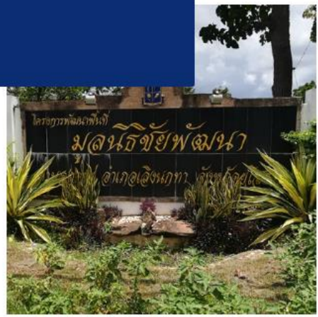
โครงการพัฒนาพื้นที่มูลนิธิชัยพัฒนา ต.กุดแห่ อ.เลิงนกทา จ.ยโสธร