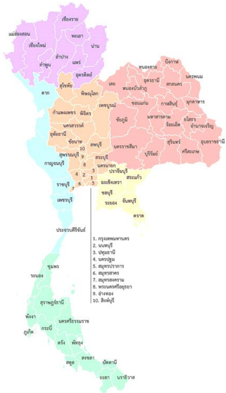
ภาพแผนที่รัฐกิจประเทศไทย