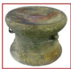
กลองมโหระทึกสำริด