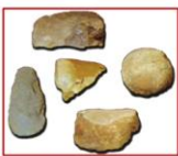
เครื่องมือหินกะเทาะ