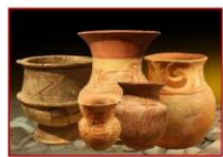
เครื่องปั้นดินเผาลายเขียนสี บ้านเชียง จ.อุดรธานี