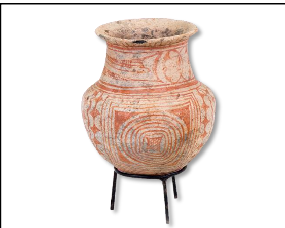
เครื่องปั้นดินเผาลายเขียนสี บ้านเชียง อุดรธานี