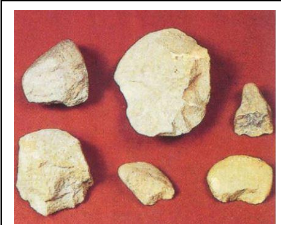
เครื่องมือหินกะเทาะ บ้านแม่ทะ ลำปาง