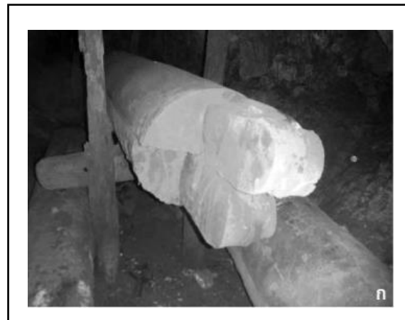
โลงศพไม้รูปเรือขุด ถ้ำผีแมน แม่ฮ่องสอน