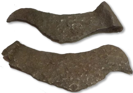
ขวานเหล็กมีบ้อง บ้านดอนตาเพชร กาญจนบุรี