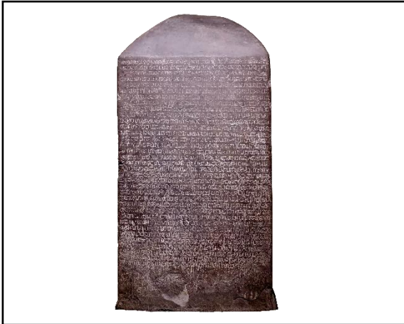
จารึกหลักที่ ๑ เมือง สุโขทัย