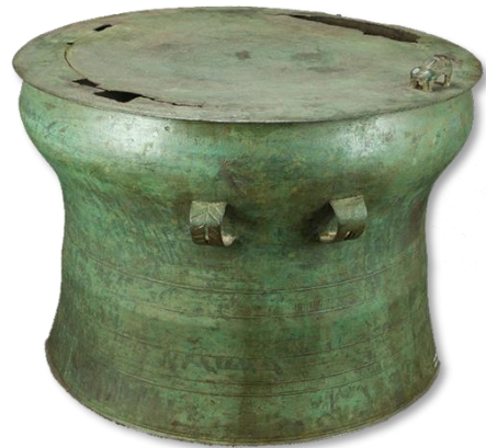
กลองมโหระทึกสำริด นาแก นครพนม