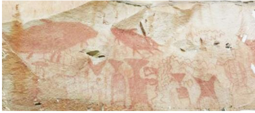
ภาพเขียนสี ผาแต้ม อุบลราชธานี