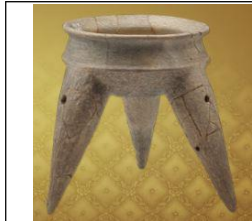
หม้อสามขา บ้านเก่า กาญจนบุรี