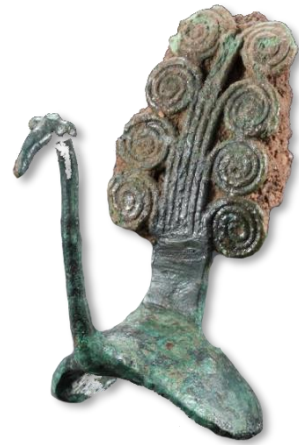
ด้ามทัพพีสำริดรูปนกยูง บ้านดอนตาเพชร กาญจนบุรี