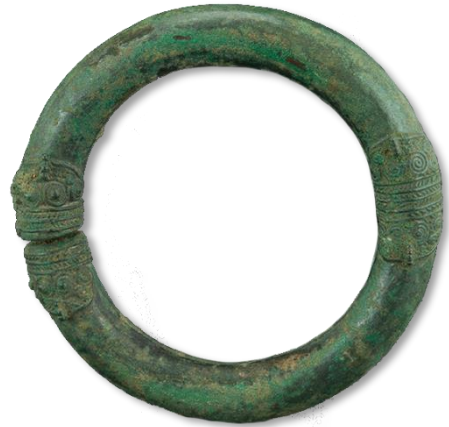
กำไลสำริด บ้านปราสาท นครราชสีมา