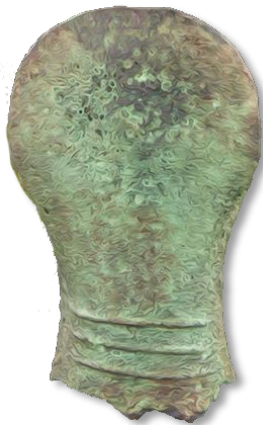
ขวานสำริด บ้านดอกกล้วย ร้อยเอ็ด