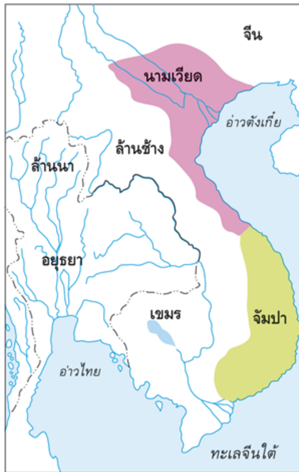
แผนที่แสดงบริเวณที่สันนิษฐานว่าเป็นที่ตั้งอาณาจักร จัมปาและนามเวียด