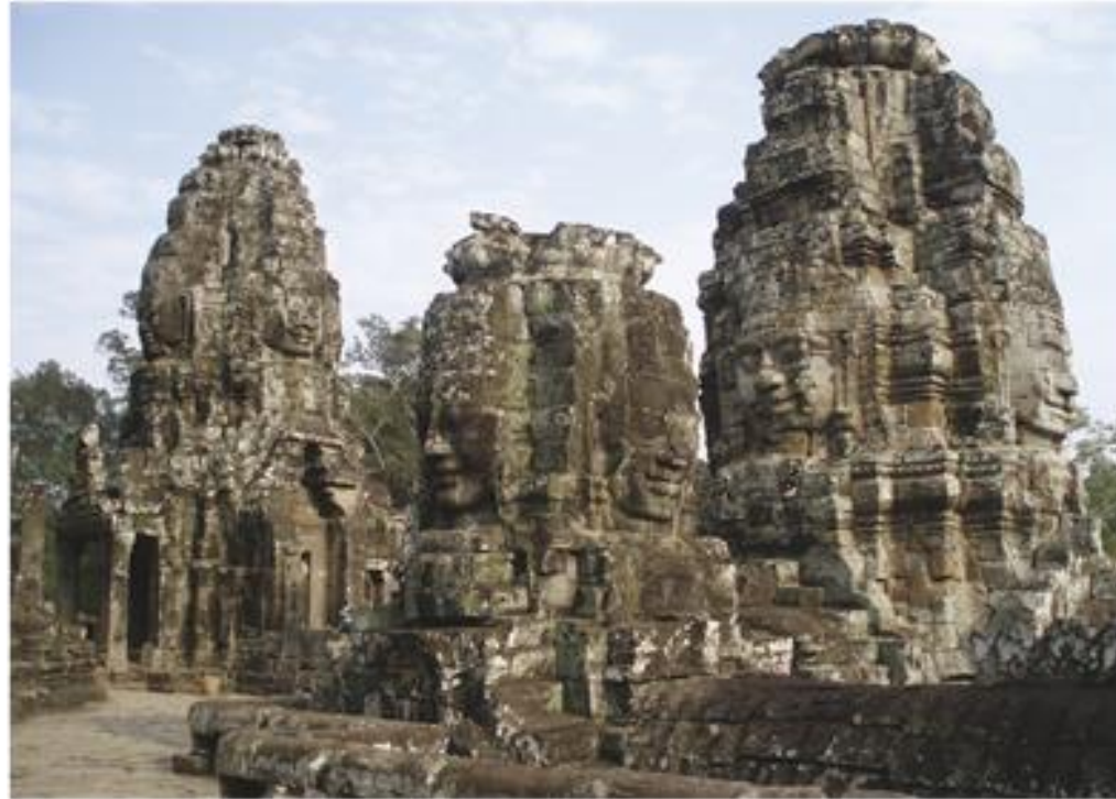
ปราสาทบายนที่นครธม สร้างขึ้นราวพุทธศตวรรษที่ 18 ในสมัยพระเจ้าชัยวรมันที่ 7