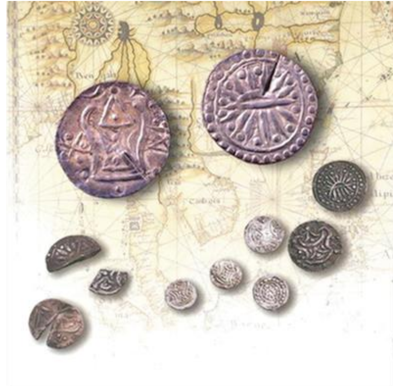
เงินตราที่ใช้ในสมัยพู้น