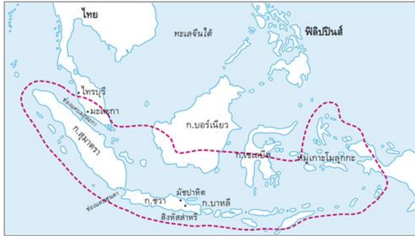
แผนที่แสดงดินแดนที่อยู่ในอำนาจของอาณาจักรมัชปาหิต