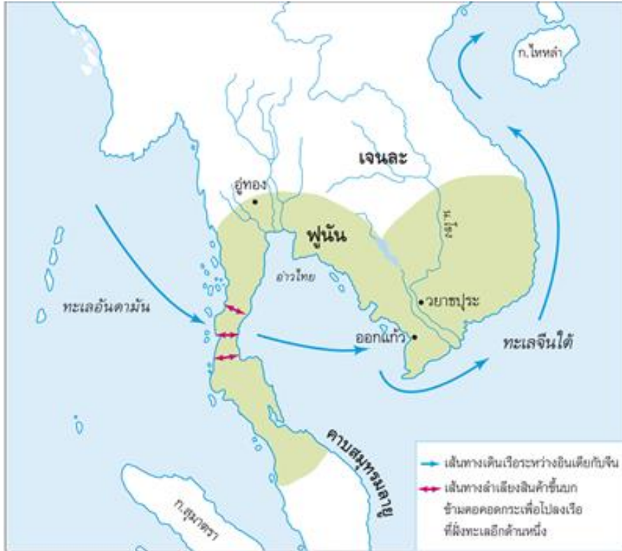
แผนที่แสดงบริเวณที่สันนิษฐานว่าเป็นที่ตั้งอาณาจักรพู้น ประมาณพุทธศตวรรษที่ 7-11