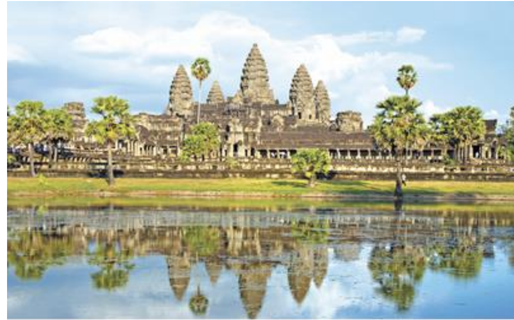
นครวัด สร้างเสร็จประมาณพุทธศตวรรษที่ 17 ในสมัยพระเจ้าสุริยวรมันที่ 2 เป็นเทวสถานในศาสนาพราหมณ์-ฮินดู นิกายไวษณพ และเป็นสิ่งมหัศจรรย์ชิ้นหนึ่งของโลก