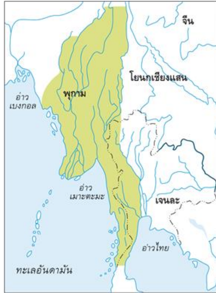
แผนที่อาณาจักรพุกาม