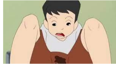
การเกิดผื่นเปื่อย