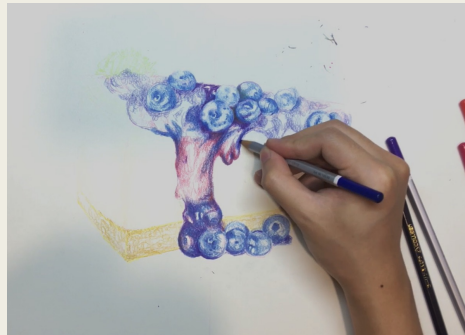
3. เติมส่วนที่มีด ใส่หน้าเค้ก