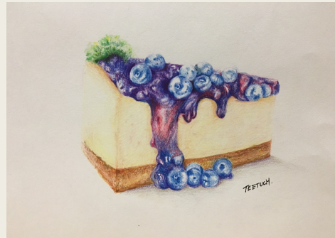
4. เก็บรายละเอียดให้ครบ