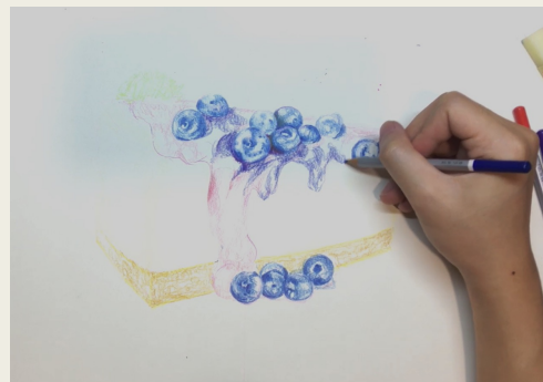
2. โล้ระดับสีจากอ่อนไปเข้ม