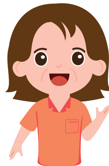
คุณป้า(แม่ครัว)