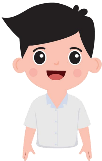
เต็มเต็ม