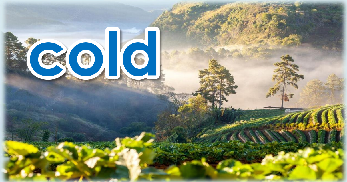
Doi Ang Khang Mountain, Chiang Mai

Doi Ang Khang Mountain is colder than Kaeng Krachan.