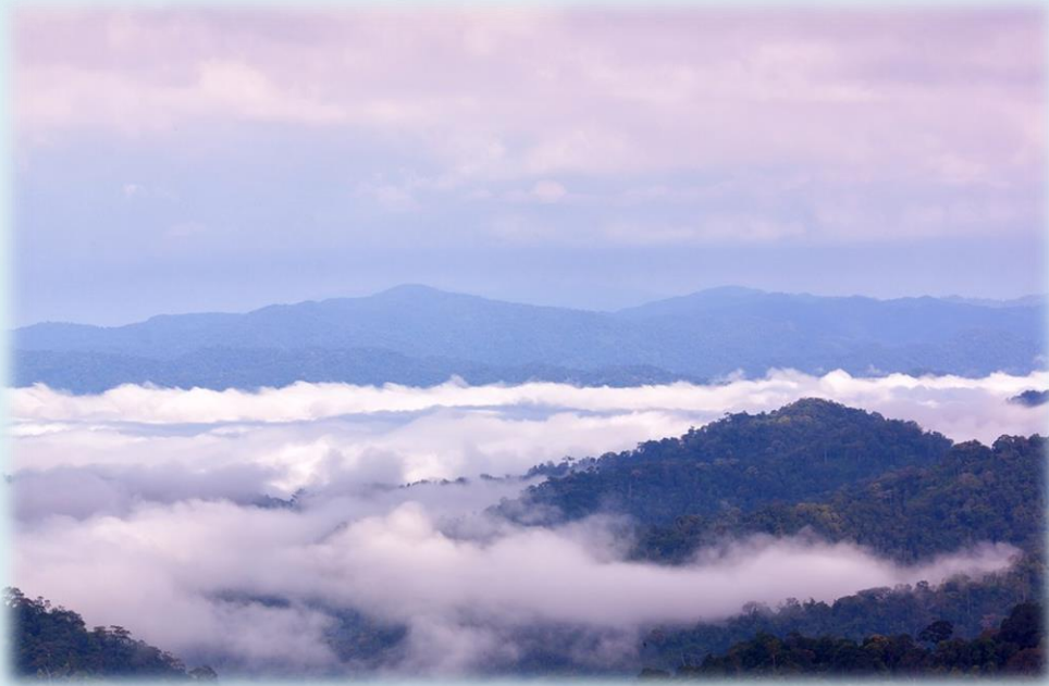
Kaeng Krachan, Petchburi