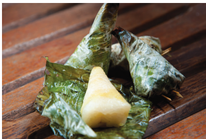
ข้าวเหนียวปิ้งห่อละ 7 บาท

คำชี้แจง จากสถานการณ์ที่กำหนดให้ ให้นักเรียนเติมคำตอบและเขียนกราฟแสดงความสัมพันธ์ระหว่างปริมาณสองปริมาณให้สมบูรณ์