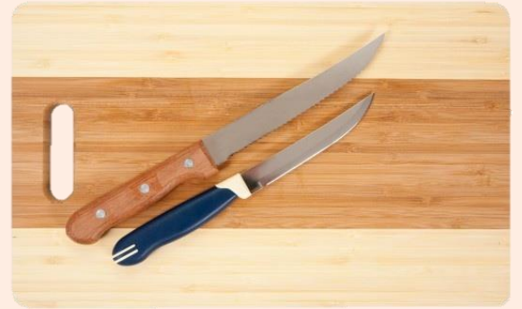
เขียงและมีด