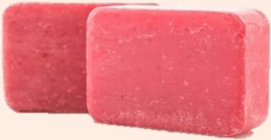
สบู่ก้อน