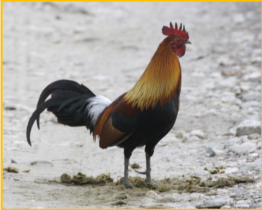
ไก่ป่าเพศผู้