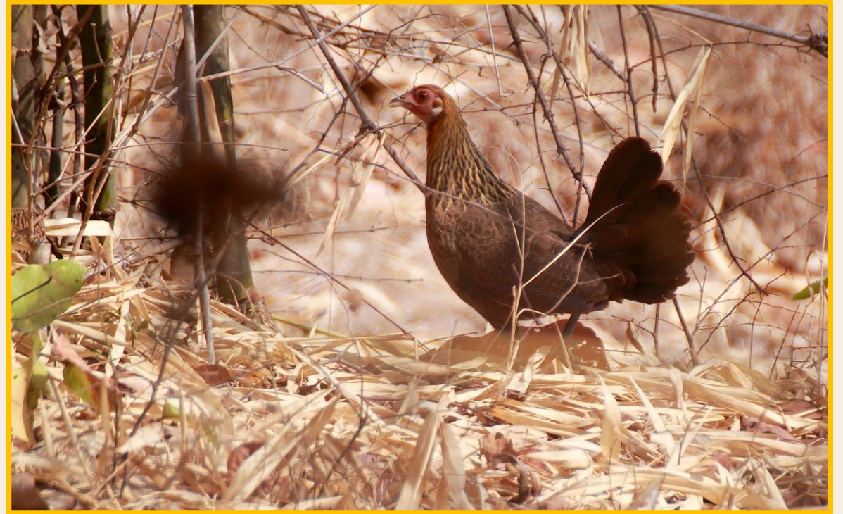
ไก่ป่าเพศเมีย