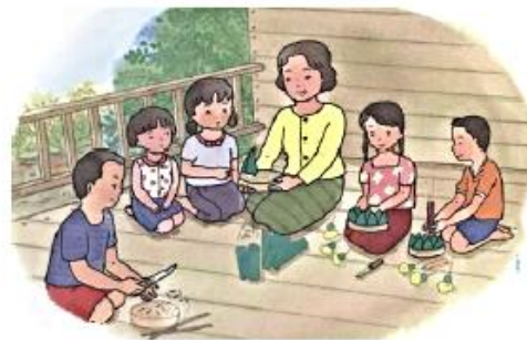
ภาพจากหนังสือแบบเรียนภาษาไทย ชั้นประถมศึกษาปีที่ ๒ ของกระทรวงศึกษาธิการ