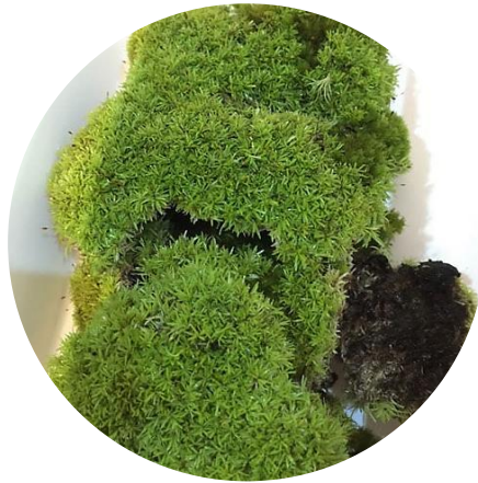
มอสละเอียด