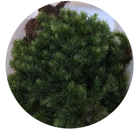
มอสหางกระรอก