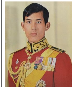
ก่อนครองราชย์ ทรงดำรงตำแหน่ง “สยามมกุฎราชกุมาร” เช่นเดียวกับรัชกาล ปัจจุบัน