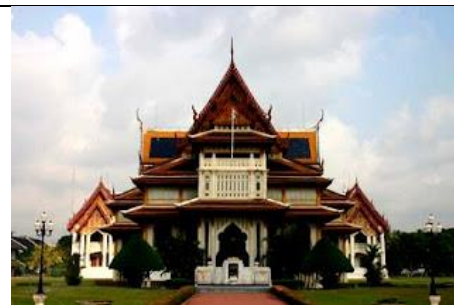
ทรงสร้างโรงเรียนแทนวัดประจำรัชกาล คือ โรงเรียนวชิราวุธวิทยาลัยในปัจจุบัน

ด้วยพระปรีชาสามารถหลายด้าน พระองค์ได้รับการทูลเกล้าฯ ถวายพระราชสมัญญาว่า