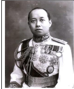
พระบรมฉายาลักษณ์ รัชกาลที่ ๖