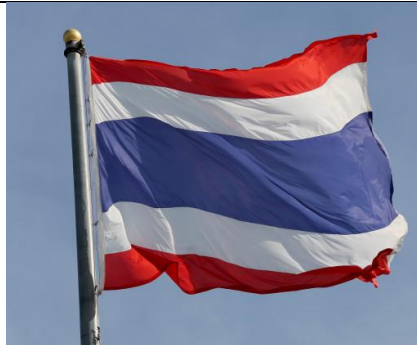
ธงเปลี่ยนธงชาติจากธงช้างเผือก มาเป็นธงไตรรงค์