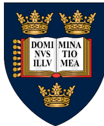
เป็นพระมหากษัตริย์องค์แรก ที่ทรงสำเร็จการศึกษา ในต่างแดน จากมหาวิทยาลัยออกซ์ฟอร์ด สหราชอาณาจักร

สยามในยุคของพระองค์ คือ จะต้องรักษามรดกตกทอดของรัชกาลที่ ๕ เอาไว้ให้ได้!