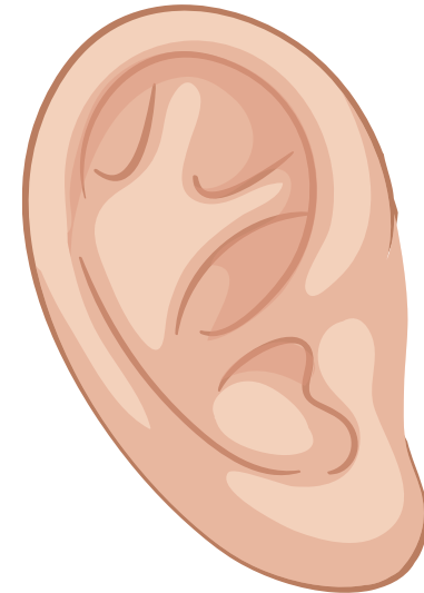
อวัยวะรับเสียง