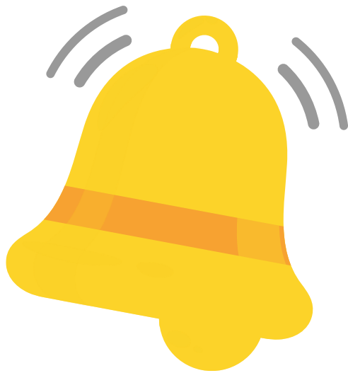
วัตถุสั่นสะเทือน