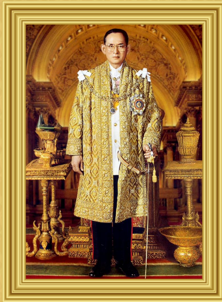
พระบาทสมเด็จพระมหาภูมิพล อดุลยเดชมหาราช บรมนาถบพิตร