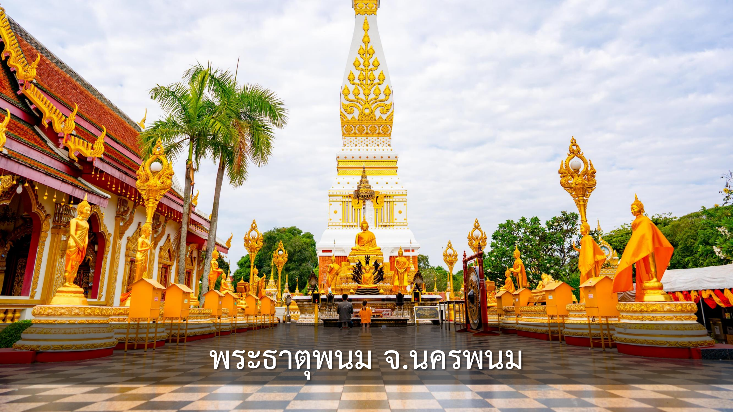
พระธาตุพนม จ.นครพนม