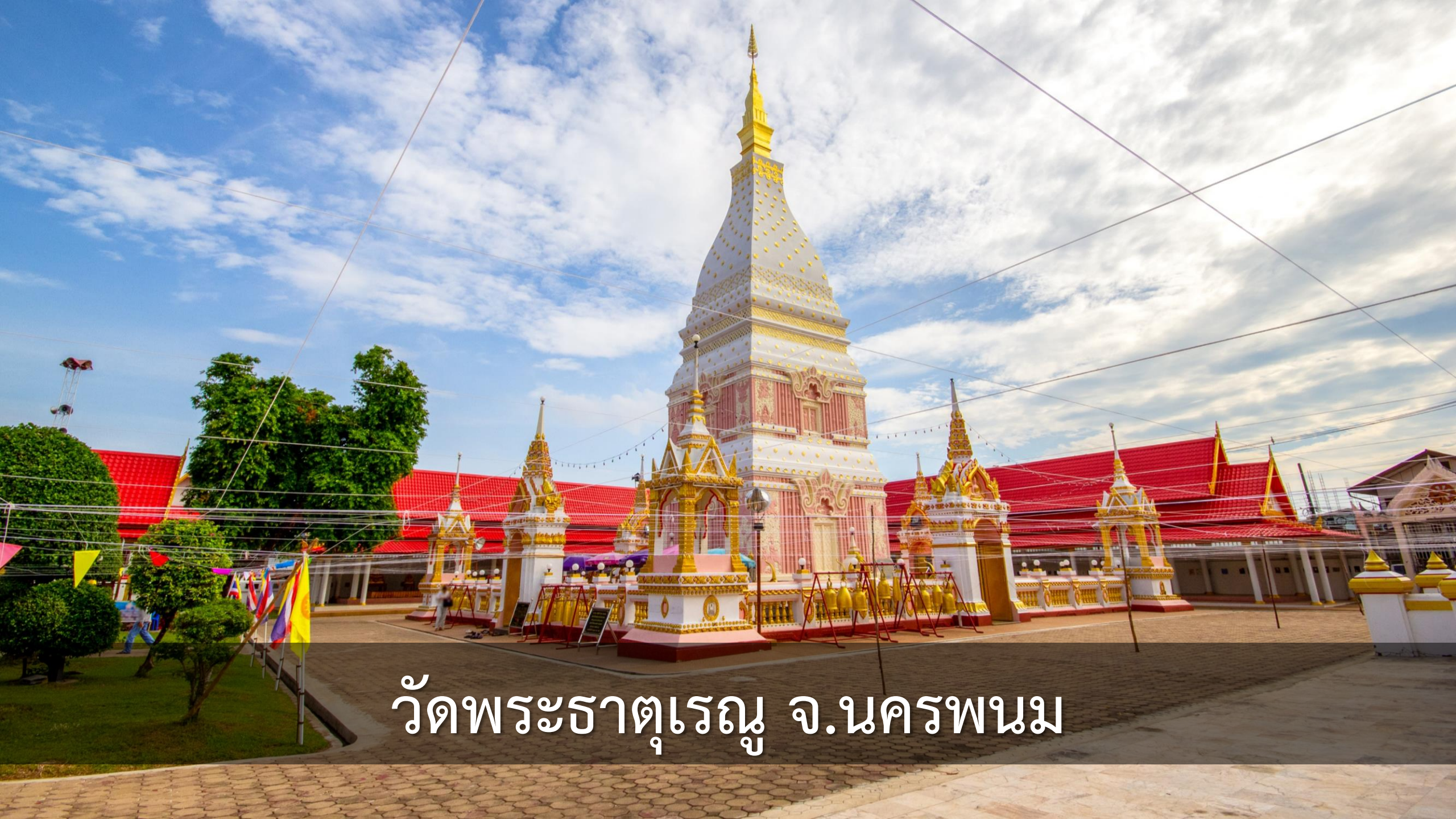
วัดพระธาตุเรณู จ.นครพนม