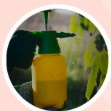
ยาฆ่าแมลง