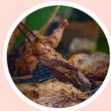
อาหารปิ้งย่าง