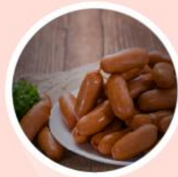
อาหารสำเร็จรูป