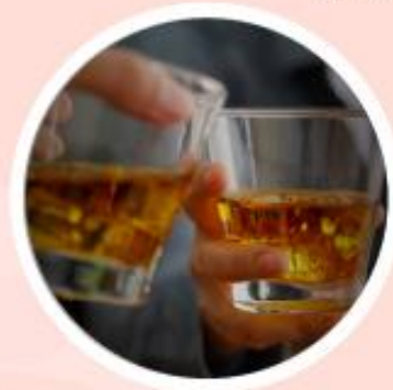
เครื่องดื่มแอลกอฮอล์