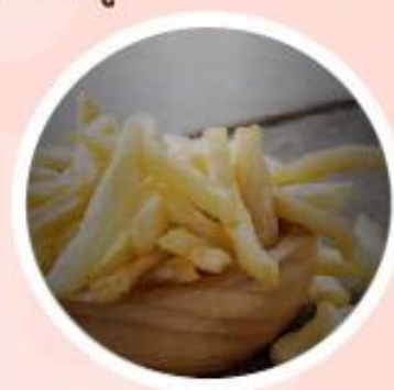
เฟรนช์ฟรายส์