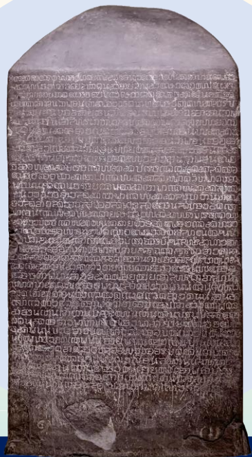
จารึกพ่อขุนรามคำแหง (จารึกหลักที่ ๑)