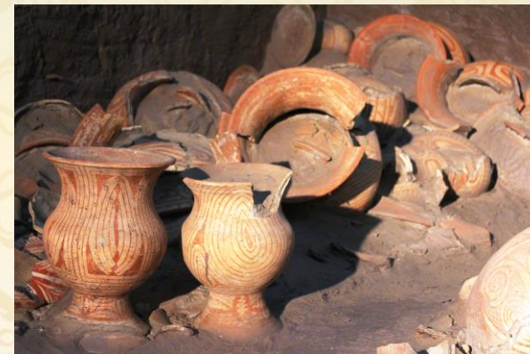
แหล่งโบราณสถานบ้านเชียง