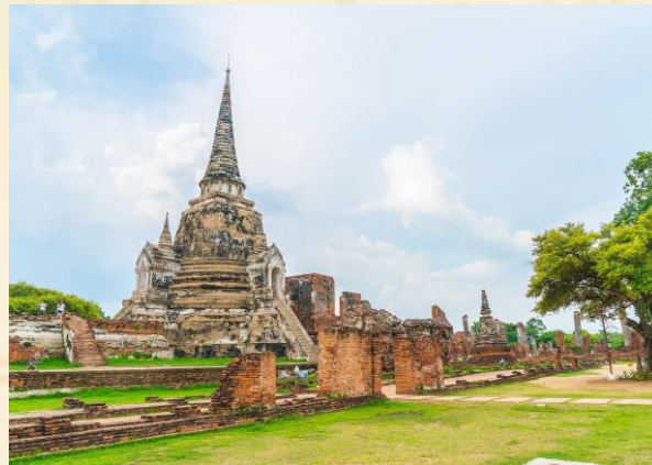
อุทยานประวัติศาสตร์พระนครศรีอยุธยา