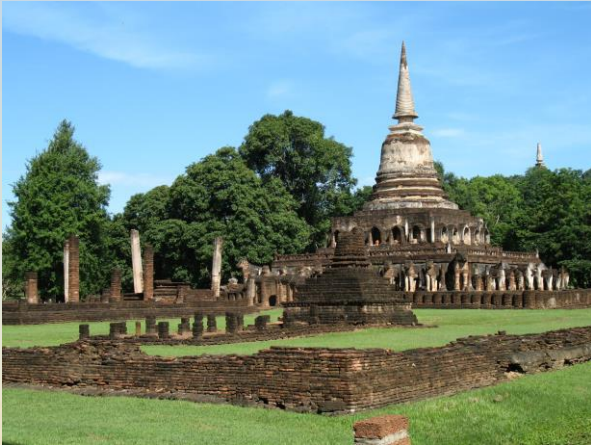
อุทยานประวัติศาสตร์ศรีสัชนาลัย