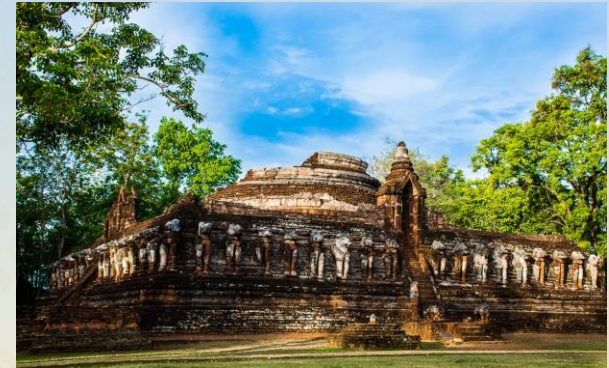
อุทยานประวัติศาสตร์กำแพงเพชร เมืองโบราณ