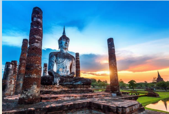
อุทยานประวัติศาสตร์สุโขทัย