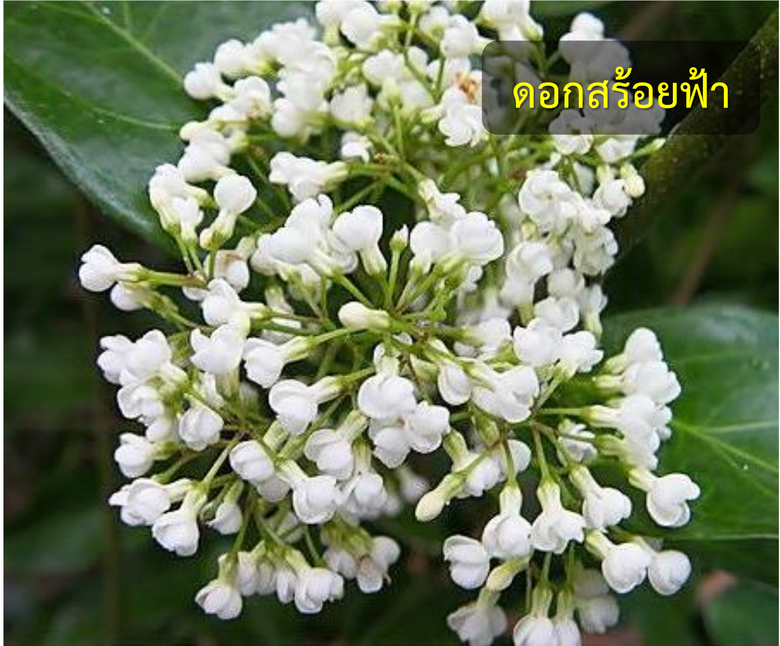
ดอกสร้อยฟ้า