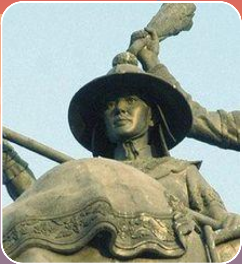
พระสุริโยทัย