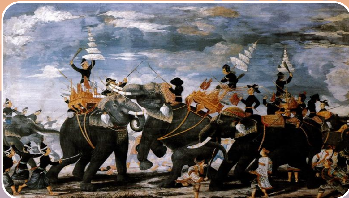
ภาพพระสุริโยทัยขาดคอช้าง