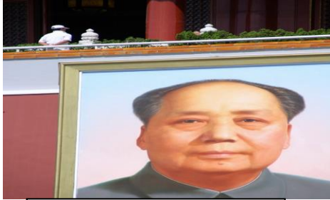
ภาพเหมาเจ๋อ ตง

๑. อารยธรรมจีนสมัยก่อนประวัติศาสตร์เรียกว่า วัฒนธรรม หยางเซา และวัฒนธรรมหลงชาน เดิมการปกครองของจีนเป็นแบบสมบูรณาญาสิทธิราชย์ จักรพรรดิฉินมีอำนาจสูงสุด ปกครองในฐานะโอรสแห่งสวรรค์ มีการสอบขุนนาง เรียกว่า สอบจอหงวน เมื่อฉิน ฟ่ายแพ้สงครามฝิ่น แก่อังกฤษ