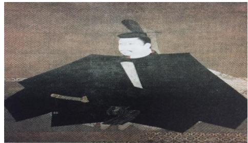
ภาพโชกุน

๒. ญี่ปุ่น มีความเชื่อเรื่องเทพเจ้าแห่งดวงอาทิตย์ และมีจักรพรรดิที่เป็นผู้สืบเชื้อสายโดยตรง แต่เป็นจักรพรรดิแต่ในนาม มีระบอบศักดินาที่กระจายอำนาจจากส่วนกลาง ญี่ปุ่นได้รับอิทธิพลจากจีนทั้งภาษา ปรัชญา วัฒนธรรม รวมทั้งการปกครอง โดยเป็นการปกครองแบบฟิวคัล จักรพรรดิทรงเป็นประมุขและมีโชกุนซึ่งเป็นผู้นำสูงสุดของขุนศึกและมีอำนาจในการปกครอง และเรียกชื่อสมัยการปกครองตามตระกูลของโชกุน ตระกูลสุดท้ายคือ โทะกุงะวะ มีอำนาจมาก มีนักรบเรียกว่า ซามูไร ต่อมา ญี่ปุ่นเริ่มค้าขายกับชาติตะวันตกและประชากรเริ่มมีการนับถือศาสนาคริสต์จำนวนมาก จึงทำให้ต้องปิดประเทศแต่ไม่นานก็ต้องเปิดประเทศเพื่อติดต่อค้าขายกับชาติต่างๆ ต่อมามีการรัฐประหารล้มรัฐบาลโชกุนและคืนอำนาจให้พระจักรพรรดิเพื่อปฏิรูปการปกครอง เรียก สมัยเมจิ ต่อมา ญี่ปุ่นได้เข้าร่วมทำสงครามโลกครั้งที่ ๒ ได้ยึดครองแมนจูเรียและเกาหลี เมื่อสงครามโลกครั้งที่ ๒ ยุติ ญี่ปุ่นเป็นฝ่ายพ่ายแพ้ หลังพ่ายแพ้สงครามโลกครั้งที่ ๒ ญี่ปุ่นถูกอเมริกายึดครองและปลุกฝังการปกครองประชาธิปไตยให้แก่ ญี่ปุ่นและประกาศใช้รัฐธรรมนูญฉบับแรกของเอเชีย ปัจจุบันมีการปกครองระบอบประชาธิปไตย มีพระจักรพรรดิทรงเป็นประมุข