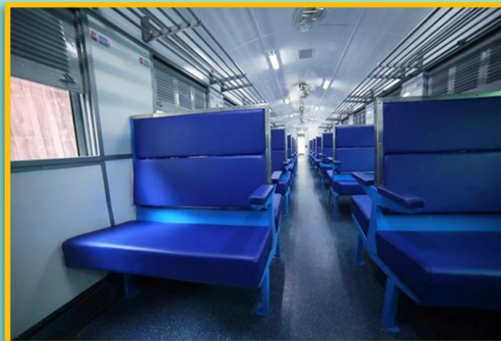
ภายในรถไฟไทยชั้น ๓

ค่าบริการรถไฟไทยชั้น ๑ จะมีราคาแพงกว่ารถไฟไทยชั้น ๓