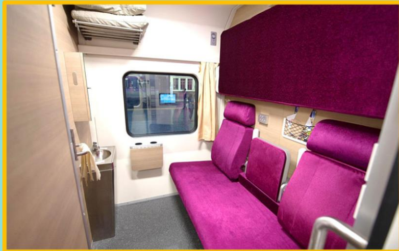
ภายในรถไฟไทยชั้น ๑