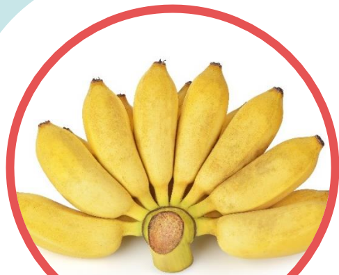
กล้วยน้ำว้า