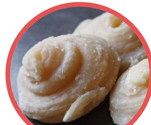
น้ำตาลมะพร้าว