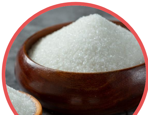
น้ำตาลทราย