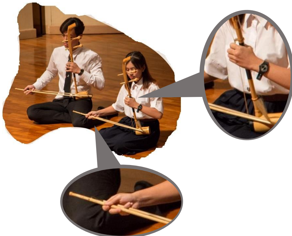
ภาพที่ ๔ การนั่งและวิธีบรรเลงซอด้วง

การจับเครื่องดนตรีและวิธีการบรรเลง มือข้างซ้ายจับคันทวน บริเวณใต้รดอกเล็กน้อย โดยให้คันทวนตั้งขึ้นในแนวตั้ง บังคับเสียงโดยใช้นิ้วมือซ้ายกดลงบนตำแหน่งต่าง ๆ ของสายซอเพื่อให้ได้ระดับเสียงที่ต้องการ ส่วนมือข้างขวาจับคันทวน เพื่อสีเข้ากับสายซอ ทำให้เกิดการสั่นสะเทือนและเกิดเสียงที่ไพเราะ