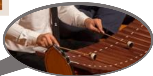
ภาพที่ ๑ การนั่งและวิธีการบรรเลงระนาดเอกและระนาดทุ้ม