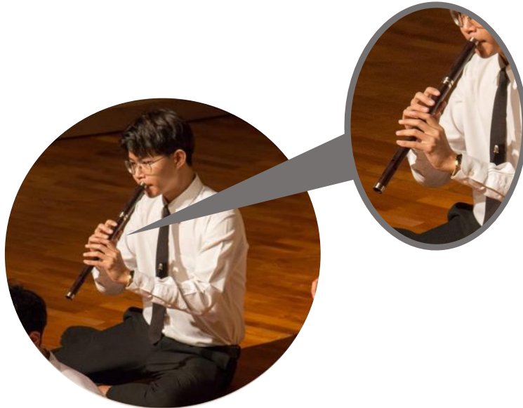
ภาพที่ ๒ การนั่งและวิธีการบรรเลงขลุ่ยเพียงออ

การนั่ง นั่งขัดสมาธิหรือพับเพียบ ลำตัวตรง หน้าตรง อาจก้มหน้ามองเครื่องดนตรีเล็กน้อย การจับเครื่องดนตรีและวิธีการบรรเลง : ใช้มือจับเครื่องดนตรี โดยให้ปลายเลาขลุ่ยเอียงลงหาพื้น นิ้วมืออยู่บริเวณรูบังคับเสียง (มือบนใช้นิ้วโป้ง นิ้วชี้ นิ้วกลาง นิ้วนาง มือล่างใช้นิ้วชี้ นิ้วกลาง นิ้วนาง และนิ้วก้อย) สำหรับการบรรเลงให้ใช้ลมจากปากเป่าให้เกิดเสียงและใช้นิ้วปิด-เปิดรูบังคับเพื่อให้ได้ระดับเสียงต่าง ๆ