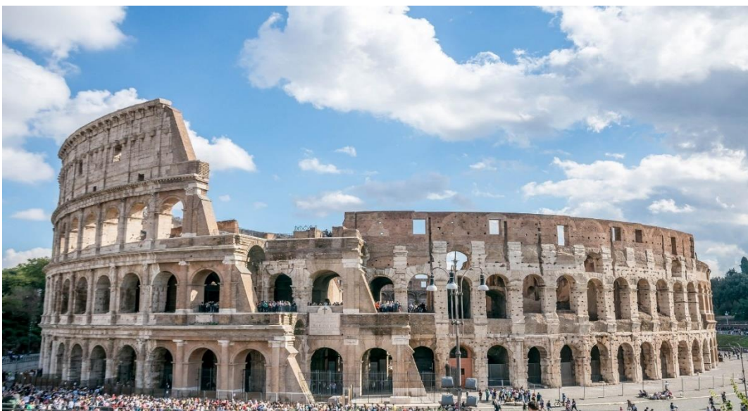
โคลอสเซียม (Colosseum)

อารยธรรมโรมันมีความเจริญก้าวหน้าทั้งทางด้านวิทยาศาสตร์และวิศวกรรม มีการสร้างอาคารสาธารณะต่าง ๆ เพื่อสนองความต้องการของรัฐและประโยชน์ใช้สอยของสาธารณชน เช่น โรงมหรสพขนาดใหญ่ที่เรียกว่า โคลอสเซียม (Colosseum) เพื่อการพักผ่อนหย่อนใจของประชาชน เช่น เป็นที่แสดงกีฬาสู้กับสิงโต สถานที่อาบน้ำสาธารณะเพื่อเป็นที่พบปะสังสรรค์ ออกกำลังกาย เป็นต้น นอกจากนี้ ชาวโรมันได้สร้างกฎหมายฉบับแรกของยุโรป เรียกว่า กฎหมายสิบสองโต๊ะ (The Code of the Twelve Tables) ซึ่งเป็นแม่บทกฎหมายของประเทศต่าง ๆ ในยุโรป ต่อมาประมาณ ๖๐ ปีก่อนคริสตศักราช ศาสนาคริสต์ได้ก่อกำเนิดขึ้น ในดินแดนปาเลสไตน์ แต่ก็ถูกชาวโรมันปราบปราม จนกระทั่งถึง ค.ศ. ๓๑๓ จักรพรรดิคอนสแตนติน (Constantine) ทรงให้เสรีภาพในการนับถือศาสนาแก่ชาวโรมันและพระองค์ก็ทรงนับถือศาสนาคริสต์ด้วย ทำให้ในเวลาต่อมาศาสนาคริสต์กลายเป็นศาสนาประจำชาติของจักรวรรดิโรมันและเผยแผ่ไปยังดินแดนต่าง ๆ ของจักรวรรดิโรมัน และเมื่อคริสต์ศตวรรษที่ ๕ จักรวรรดิโรมันเริ่มเสื่อมลงและถูกชนเผ่าเยอรมันเข้ามารุกราน ในที่สุดชนเผ่าเยอรมันก็ยึดกรุงโรมได้เมื่อ ค.ศ. ๔๗๖ นับเป็นการสิ้นสุดสมัยโบราณ