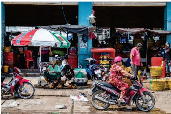
ภาพอาชีพค้าขายในประเทศเวียดนาม