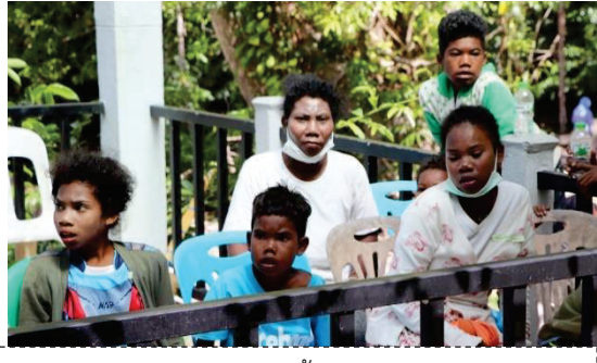
ภาพชาวซาไก เชื้อสายนิกรอยด์