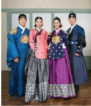
ชุดฮันบก