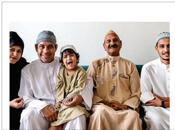
ภาพชาวอาหรับเชื้อสายคอเคซอยด์

เป็นพวกผิวขาว รูปร่างสูงใหญ่และหน้าตาเหมือนชาวยุโรป แต่ตาดำและผมมีสีดำ ส่วนใหญ่อาศัยอยู่ในเอเชียตะวันตกเฉียงใต้ และทางภาคเหนือของอินเดีย ได้แก่ ชาวอาหรับ ชาวปากีสถาน ชาวอินเดีย ประชากรในประเทศเนปาล ภูฏาน