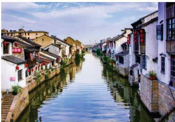
เมืองโบราณในจีน