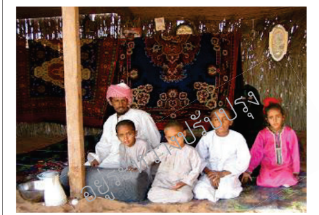
ภาพชาวเบดูอินอาศัยอยู่ในกระท่อม