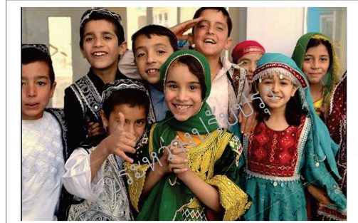
ภาพประชากรในเอเชียกลาง