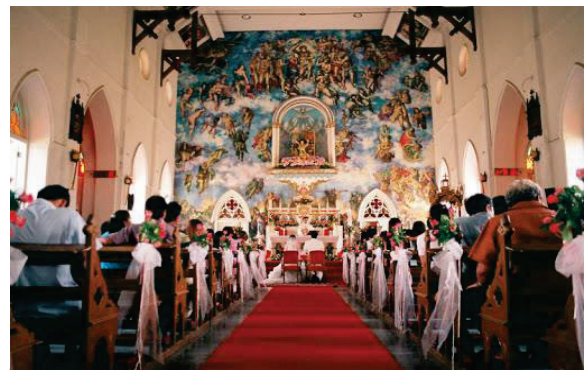
ภาพการประกอบพิธีกรรมทางศาสนาในประเทศฟิลิปปินส์