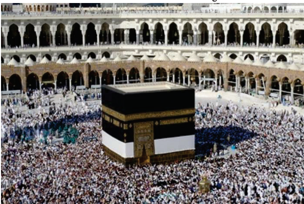
ภาพการประกอบพิธีฮัจญ์ของศาสนาอิสลาม