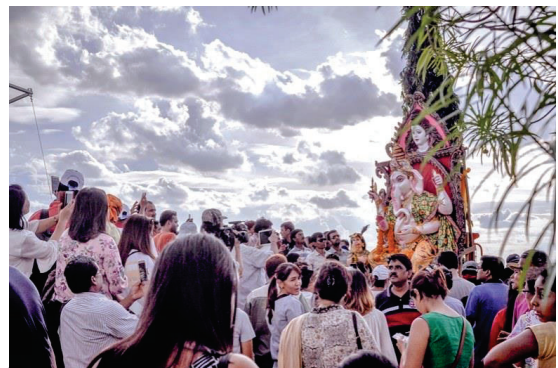
การเฉลิมฉลองเนื่องในโอกาสเป็นคล้ายวันประสูติ ของพระคเณศวร