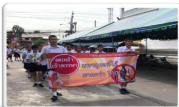
การนรณรงค์ลดสุราและสารเสพติด สามารถนำมาเป็นส่วนหนึ่งของการดำเนินการตามการกำหนดแนวทางการสร้างชุมชนคนดี วิถีความสุข

ผู้ที่มีส่วนเกี่ยวข้องติดตาม กำกับและนำแนวทางการสร้างชุมชนคนดี วิถีความสุขไปใช้ในการบริหารชุมชนให้เกิดความสำเร็จร่วมกัน โดยนักเรียนมีหน้าที่ในการนิเทศติดตามร่วมกับฝ่ายที่เกี่ยวข้อง เพื่อนำผลการดำเนินการตามแนวทางการสร้างชุมชนคนดี วิถีความสุข ที่ได้ใช้จริงมาวิเคราะห์ปรับปรุงให้เหมาะสมกับท้องถิ่นของตน