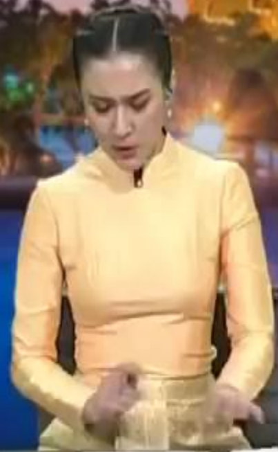
ทำราชวรดิษฐ์ กรุงเทพมหานคร