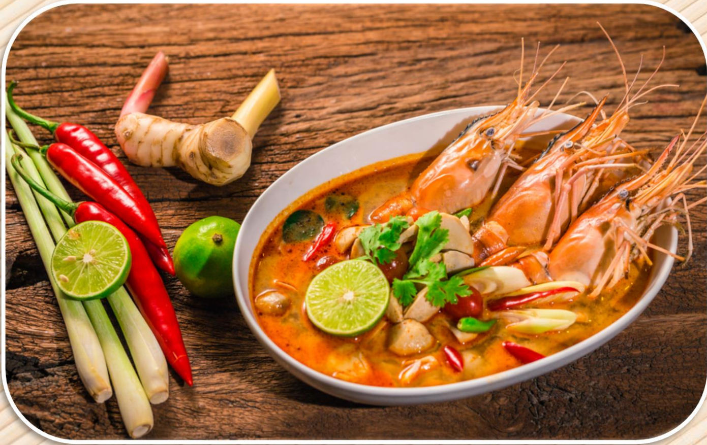
Tom Yum Kung