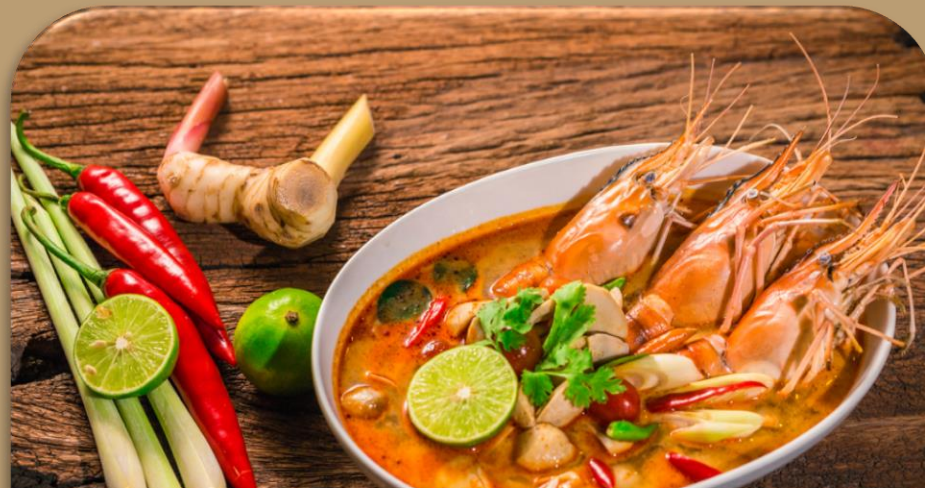
Tom Yum Kung