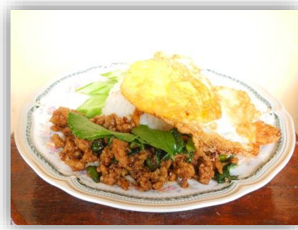
ข้าวกะเพราหมูสับไข่ดาว ราคา ๓๐ บาท