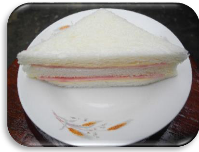
แซนวิชแฮมชีส ราคา ๑๒ บาท