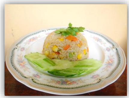
ข้าวผัดไข่ ราคา ๒๕ บาท