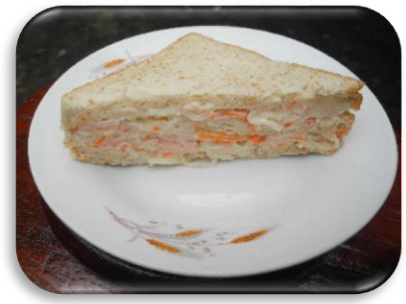
แซนวิชปู้ด ราคา ๑๐ บาท