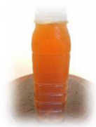
น้ำลำไย ราคา ๑๐ บาท