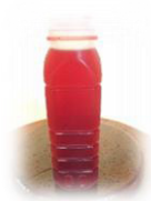
น้ำกระเจียบ ราคา ๘ บาท