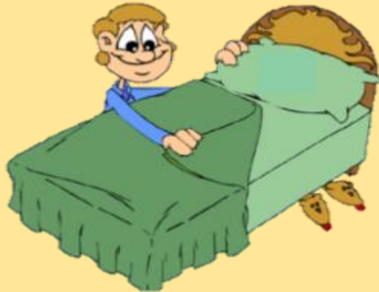
4. make the bed