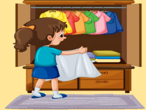
3. fold the clothes