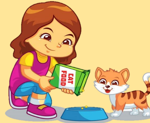
5. feed the cat