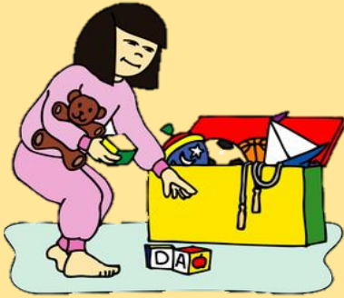
1. tidy the room