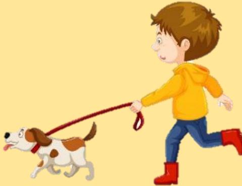
2. walk the dog