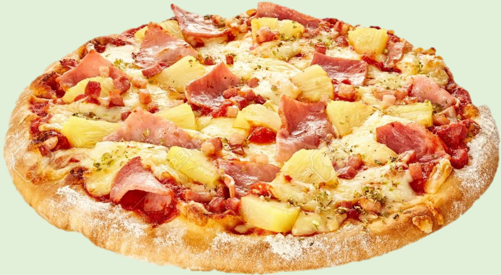
Ham, cheese & pineapple pizza