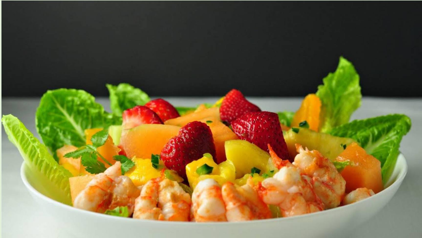
shrimp & fresh fruit salad