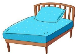
There is a pillow on a bed.

There are two curtains beside the bed. (มีผ้าม่าน 2 ผืนอยู่ข้างเตียง)