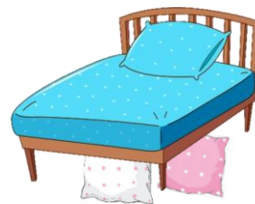
There are two cushions under the bed.