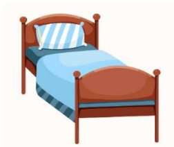
There is a mattress on the bed.