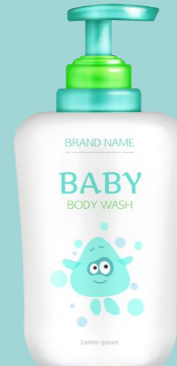
ครีมอาบน้ำ

หากนักเรียนจะเลือกซื้อสบู่ นักเรียนจะเลือกซื้อสบู่ ประเภทใดและเพราะเหตุใดจึงเลือกซื้อสบู่ประเภทนั้น