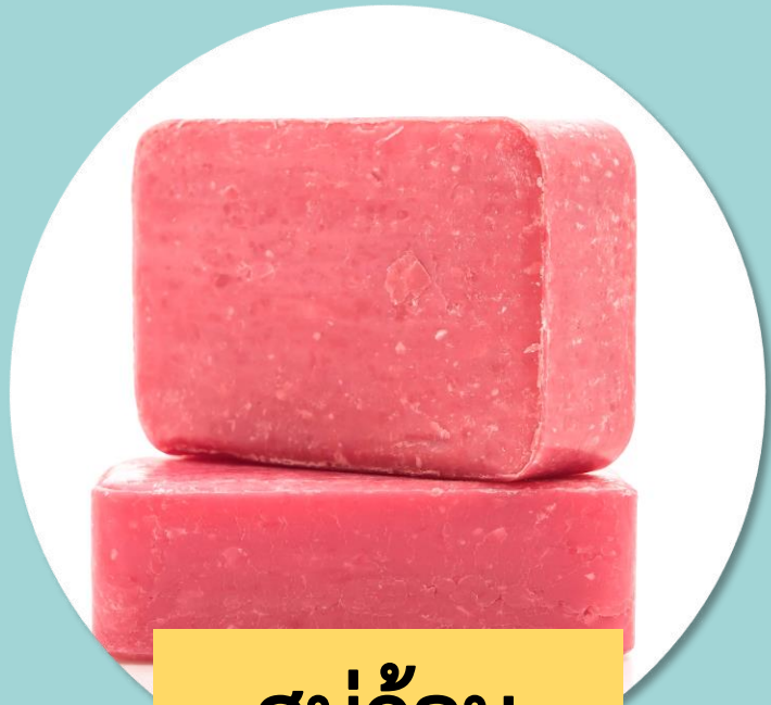
สบู่ก้อน