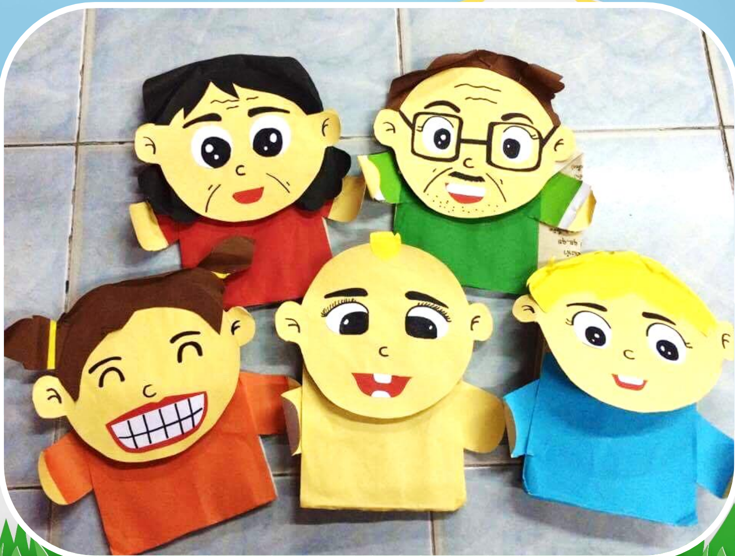
ขอบคุณภาพจาก Facebook สื่อปฐมวัย รับทำสื่อการสอนทุกประเภท ราคาถูก