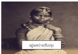
ภาพชาวมีฬ