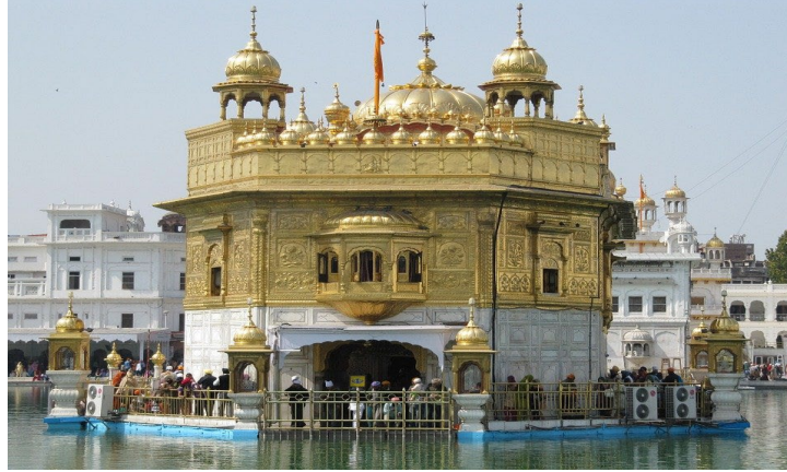
สุวรรณวิหาร เมืองอมริตสาร์ ศาสนสถานสำคัญของศาสนาซิกข์