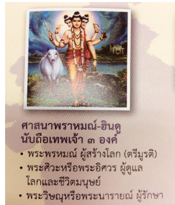
ศาสนาพราหมณ์-ฮินดู นับถือเทพเจ้า ๓ องค์ • พระพรหม ผู้สร้างโลก (ตรีมุรติ) • พระศิวะหรือพระอิศวร ผู้ดูแลโลกและชีวิตมนุษย์ • พระวิษณุหรือพระนารายณ์ ผู้รักษา

ในยุคนี้เป็นยุคที่ศาสนาพราหมณ์มีความเจริญเป็นอย่างมาก โดยได้พัฒนาจากความเชื่อดั้งเดิมของชาวอารยันในการนับถือพระเจ้าหลายองค์ โดยเทพเจ้าสูงสุดของศาสนาพราหมณ์ คือ พระศิวะ หรือ พระอิศวร เป็นเทพเจ้าที่มีอำนาจสูงสุด พระวิษณุ หรือ พระนารายณ์ ซึ่งจะอวตารลงมาเกิดในโลกมนุษย์เพื่อดับทุกข์เข็ญ และ พระพรหม ผู้สร้างโลก พราหมณ์เป็นผู้ที่ติดต่อกับเทพเจ้าได้ด้วยการประกอบพิธีกรรมและร่ายบทสวดมนต์บูชาเทพเจ้าตามคัมภีร์พระเวท ดังนั้นจึงมีบทบาทสำคัญในสังคมอินเดีย อนึ่ง ศาสนายังสอนให้คนยอมรับเรื่องการเวียนว่ายตายเกิด ทำให้ชาวอินเดียยอมรับชะตากรรมของตนในโลกปัจจุบัน ซึ่งรวมถึงการดำรงอยู่ในวรรณะที่ถูกกำหนดมาตั้งแต่เกิด แล้วมุ่งทำความดี