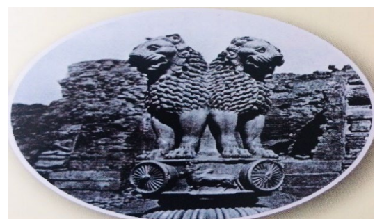
เสาทินอโศก

ที่มา : หนังสือเรียนประวัติศาสตร์, ศธ. สพฐ., พ.ศ. ๒๕๕๔, ระดับชั้นมัธยมศึกษาปีที่ ๒, หน้า ๑๑๔