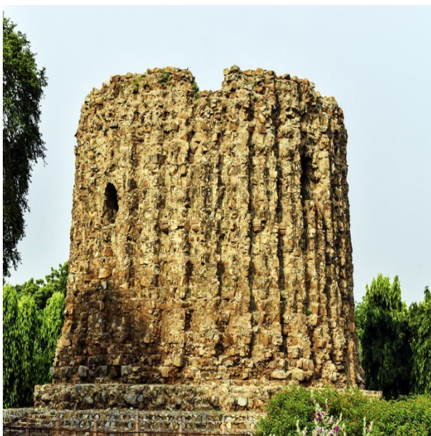
กุตูป มินาร์ (Qutb Minar) กรุงนิวเดลี

ด้านวิทยาการ มีการศึกษา ด้านคณิตศาสตร์และวิทยาศาสตร์อย่างกว้างขวาง ในช่วงคริสต์ศตวรรษที่ ๕ อาณาจักรของราชวงศ์คุปตะก็เริ่มแตกแยกเป็นแคว้นเล็กแคว้นน้อย ประกอบกับถูกพวกเชื้อสายเตอร์กเข้ามาโจมตี ในที่สุดราชวงศ์คุปตะก็สลายไปราวคริสต์ศตวรรษที่ ๖