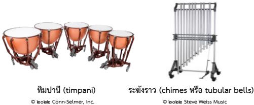
ทิมปานี (timpani)