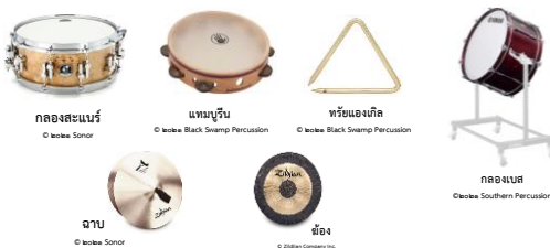
กลองสะแนร์