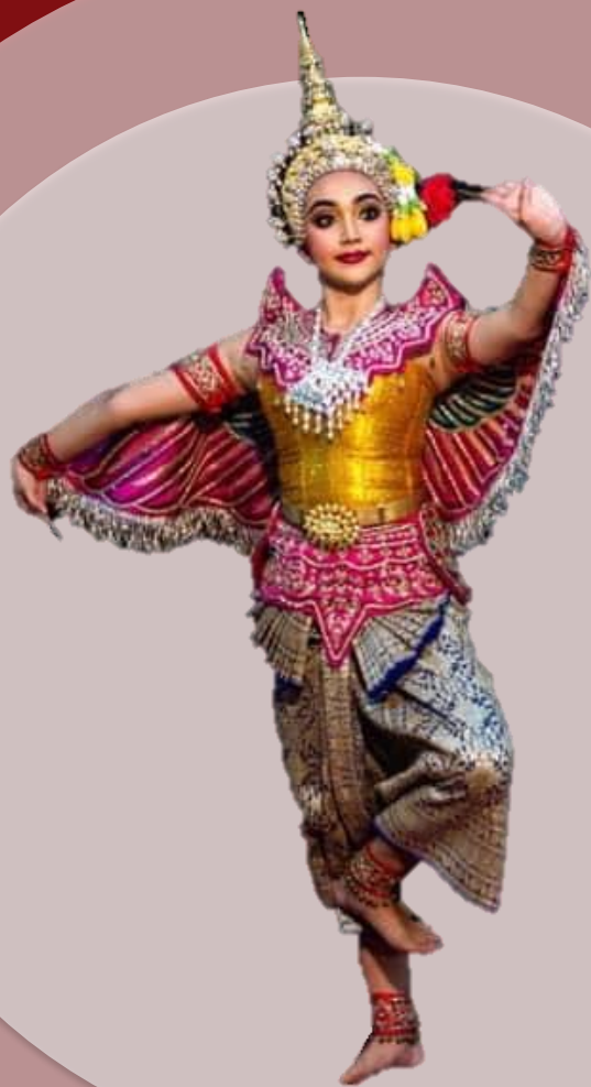
เครดิต: นางเอกข่าวโพต วชิราภรณ์