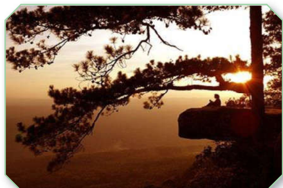
ภูกระดึง จังหวัดเลย