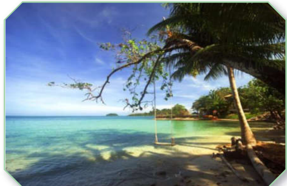
เกาะช้าง จังหวัดตราด