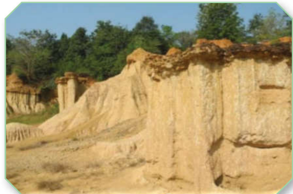
แพะเมืองผี จังหวัดแพร่