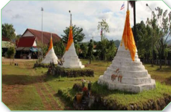
ด่านเจดีย์สามองค์ จังหวัดกาญจนบุรี