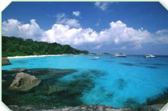
เกาะพีพี จังหวัดกระบี่