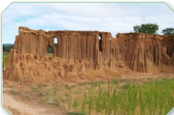
ละลุ จังหวัดสระแก้ว