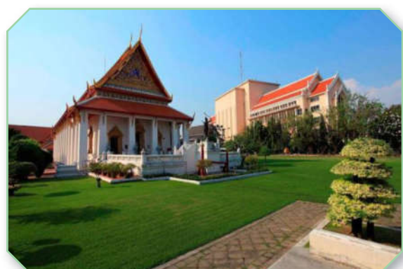
พิพิธภัณฑสถานแห่งชาติ