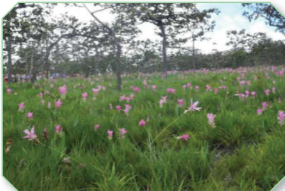
อุทยานแห่งชาติป่าหินงาม จังหวัดชัยภูมิ