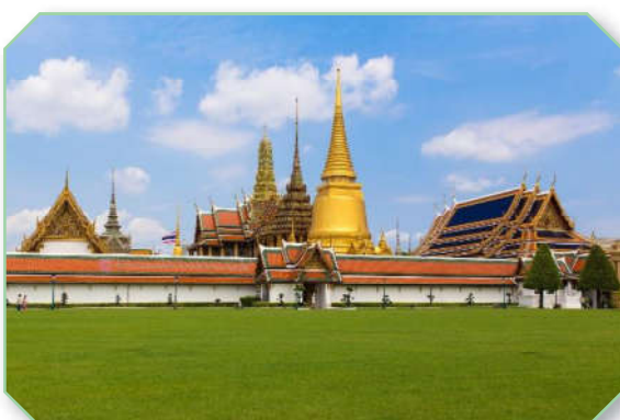
วัดพระแก้ว