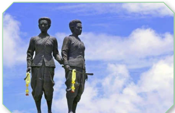
อนุสาวรีย์ท้าวเทพกษัตรี ท้าวศรีสุนทร