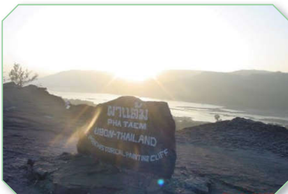
อุทยานแห่งชาติผาแต้ม จังหวัดอุบลราชธานี