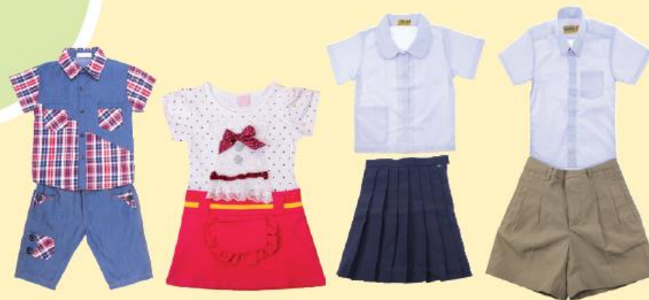
เครื่องนุ่งห่ม