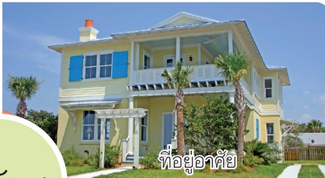
ที่อยู่อาศัย