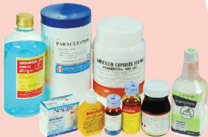
ยารักษาโรค