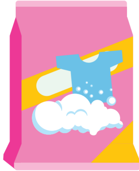
ผงซักฟอก 57.75 บาท