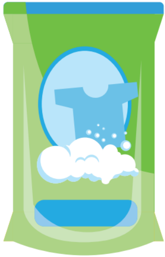
น้ำยาซักผ้า 68.50 บาท