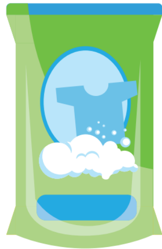
น้ำยาซักผ้า 68.50 บาท

แม่ซื้อน้ำยาซักผ้า 1 ถุง ราคา 68.50 บาท กับ ผงซักฟอก 1 ถุง ราคา 57.75 บาท แม่ต้องจ่ายเงินกี่บาท