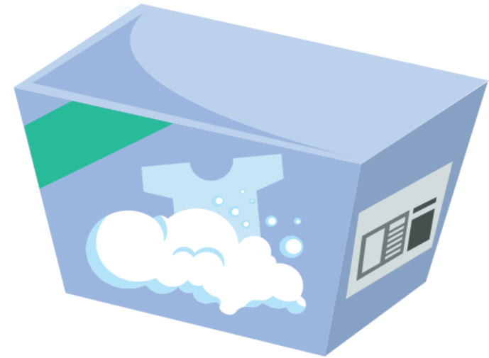
เจลซักผ้า 139.25 บาท

จะทราบได้อย่างไรว่าเจลซักผ้าราคาแพงกว่าผงซักฟอกก็บาท