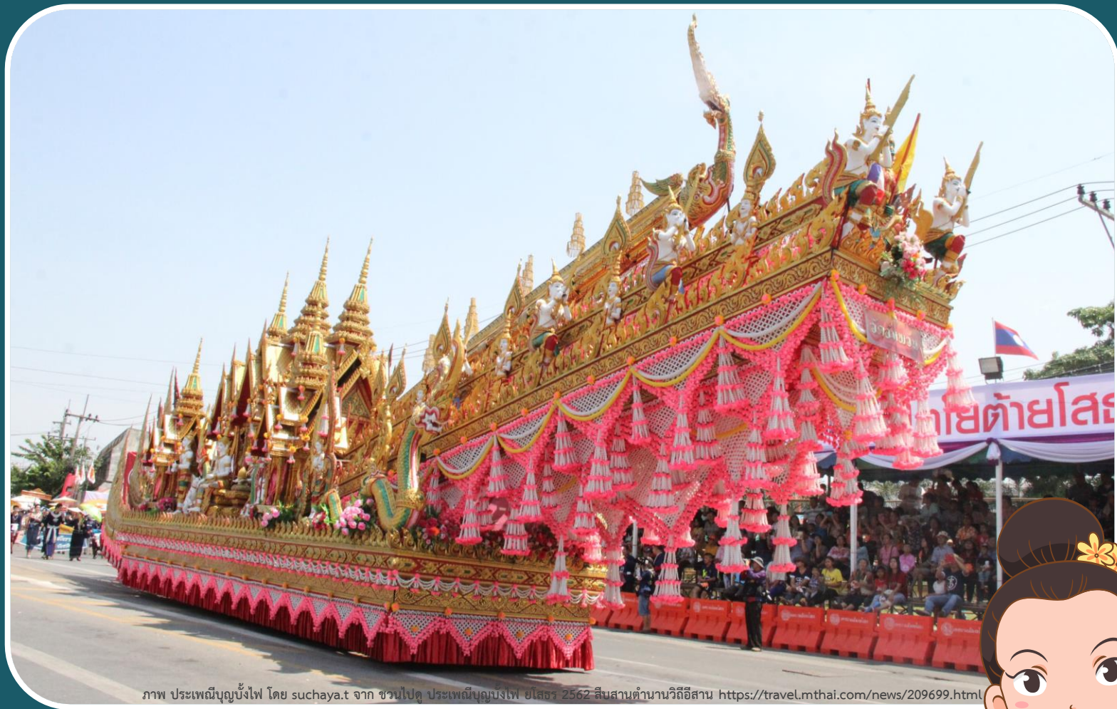
ภาพ ประเพณีบุญบั้งไฟ