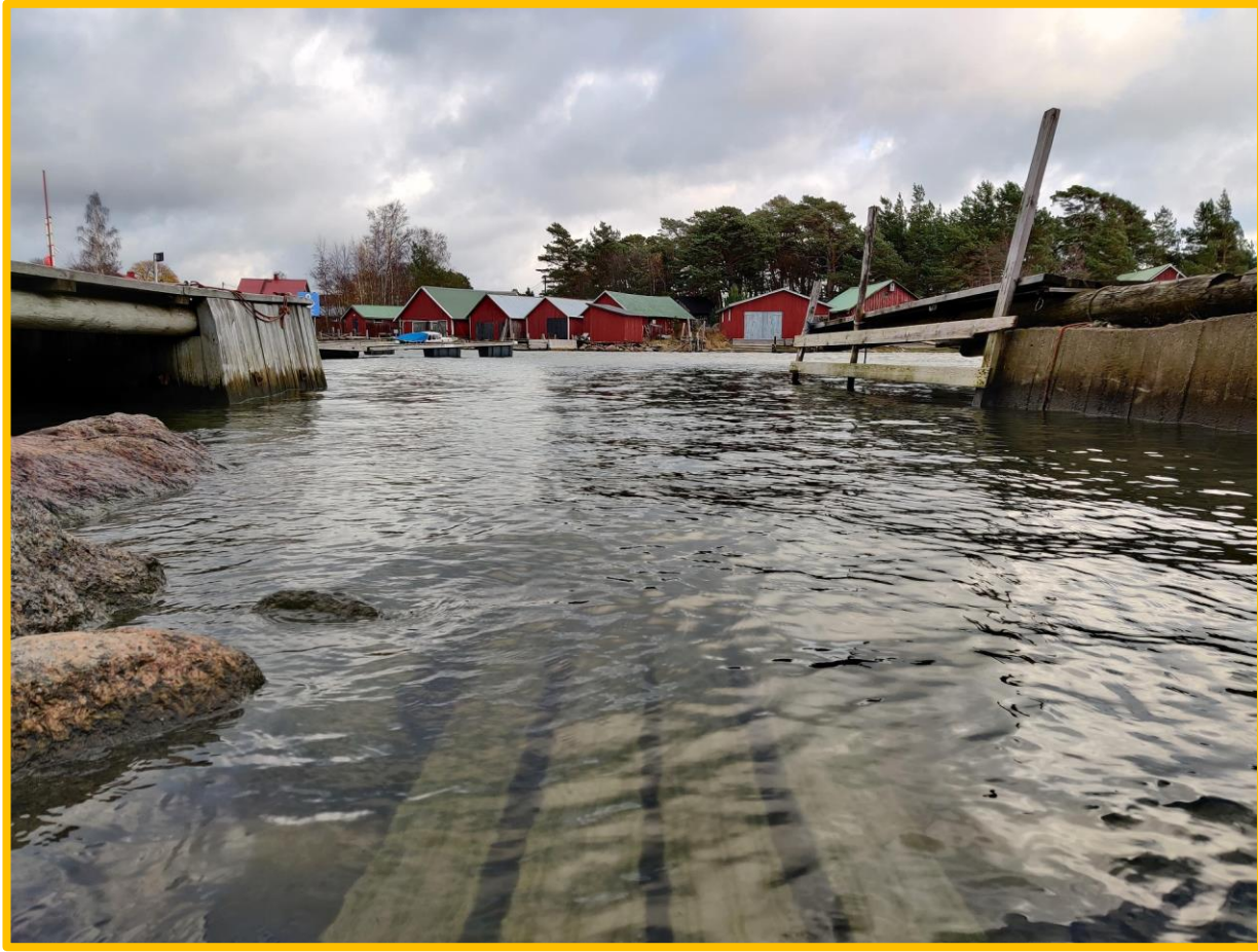
ภาพ ตลิ่งน้ำ โดย softcore จากเว็บ https://pixabay.com/th/photos/น้ำ-พื้นผิว-ตลิ่ง-หมู่บ้าน-คลื่น-๖๐๒๕๔๙๕/